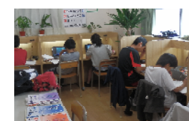
自習室はいつでも開放！