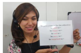
外国人講師のオンライン授業

2020年度に大学入試は大きく変わります。特に英語においては「4技能のコミュニケーション能力が適切に評価される」入試に変わり始めます。現在の高校1年生から中学1年生はリーディング(長文)とリスニングの2技能の新テスト(大学入学共通テスト)を受験します。配点は2技能が50%ずつになる予定とされています。さらに、これに「民間4技能試験(英検など)を全体の2割以上の配点」とする加点方式をとる国立大学や私大があります。さらに現在の小学6年生からはこの新テストが廃止になり、すべてが民間試験(英検など)になる予定です。このように大学入試の劇的な変化が日本の英語教育を大きく変えつつあります。英語は楽器やスポーツと同じ実技科目です。ピアノを弾くためには楽譜を読む必要がありますが、楽譜の読み方ばかりを延々と学んでも、決してピアノが弾けるようにはなりません。楽譜の読み方を覚えながらピアノを弾く。つまり インプットとアウトプットをくり返し ながら、少しずつ上達していきます。英語も全く同じで、使わないと、使えるようにならないのです。