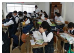
テスト期間中学年合同朝勉