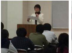
作文・小論文特別講座