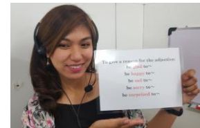
外国人講師のオンライン授業

2020年度に大学入試は大きく変わります。特に英語においては「4技能のコミュニケーション能力が適切に評価される」入試に変わり始めます。現在の高校1年生から中学1年生はリーディング(長文)とリスニングの2技能の新テスト(大学入学共通テスト)を受験します。配点は2技能が50%ずつになる予定とされています。さらに、これに「民間4技能試験(英検など)を全体の2割以上の配点」とする加点方式をとる国立大学や私大があります。さらに現在の小学6年生からはこの新テストが廃止になり、すべてが民間試験(英検など)になる予定です。このように大学入試の劇的な変化が日本の英語教育を大きく変えつつあります。英語は楽器やスポーツと同じ実技科目です。ピアノを弾くためには楽譜を読む必要がありますが、楽譜の読み方ばかりを延々と学んでも、決してピアノが弾けるようにはなりません。楽譜の読み方を覚えながらピアノを弾く。つまり インプットとアウトプットをくり返し ながら、少しずつ上達していきます。英語も全く同じで、使わないと、使えるようにならないのです。